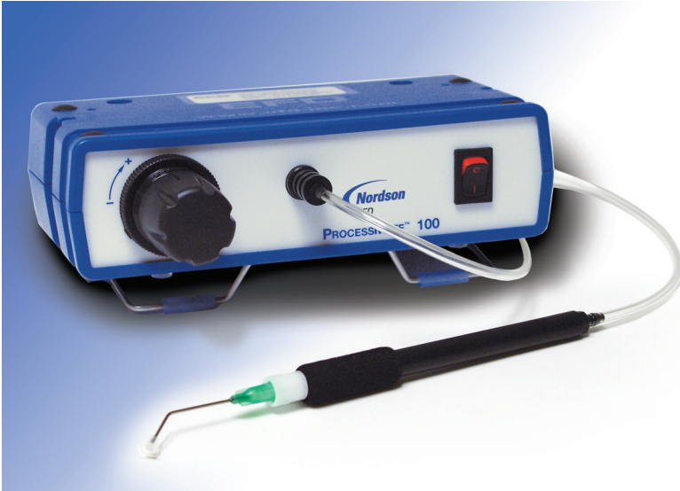
ProcessMate 100 dank eines leichtgewichtigen Aufnahmestifts Beschädigungen an komplexen Bauteilen.

Lassen sich kleine und empfindliche Bauteile einfach und effizient heben und positionieren.