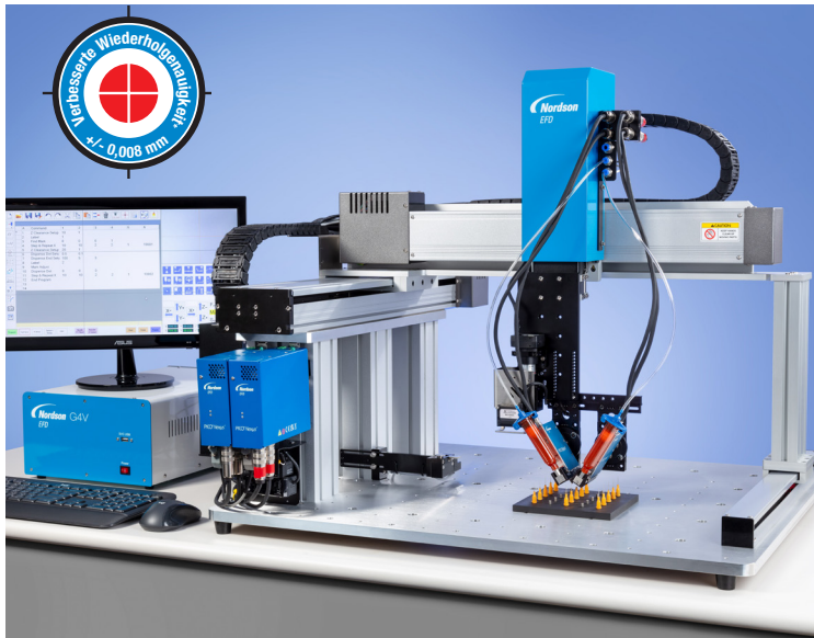
Die GVPlus-Serie bietet zwei Montageflansche mit zusätzlicher Abstützung, wodurch Vibrationen reduziert werden.