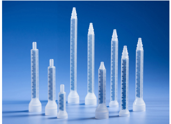
Der Nordson EFD 480 OptiMixer bietet eine bessere Mischqualität bei kürzerer Länge.