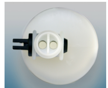
Große Bohrungen für einen größeren Durchfluss