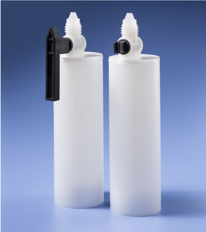
Der robuste Halsauslass verhindert Rissbildung.

Die 380ml-Koaxialkartusche hat ein zylindrisches Innen- und Außenrohr für je ein Material im Mischverhältnis 10:1. Die Kartusche wird mit einem bereits integriertem Drehverschluss geliefert, der die Kartusche öffnet und wieder verschließt. Ein zusätzlicher Steck- oder Schraubverschluss ist nicht notwendig.