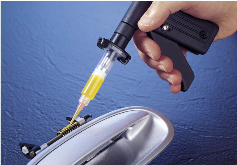
Pistolet de dépose simplifie l'application de fluides de moyenne à forte viscosité.

Simplifie l'application de fluides de moyenne à forte viscosité