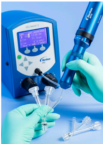
使用HPx™工具为医疗配件点涂胶黏剂。