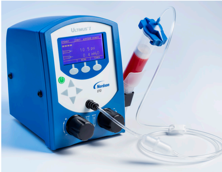
Ultimus点胶机为医疗设备、电子行业和其他严苛的点胶工艺提供卓越的流程控制。

由于具有同步的数字显示以及精确到0.0001秒的时间控制，Ultimus点胶机可以对医疗设备、电子设备以及要求严格的点胶工艺进行极为有效的全程控制。