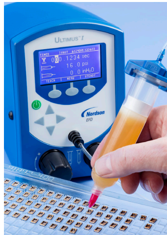
为电子行业组件点涂助焊剂。