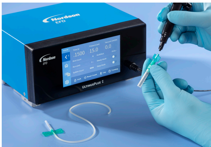
直观的触摸屏界面可简化设置和编程, 感受市场领先的使用体验。

使用诺信EFD的UltimusPlus™点胶机, 感受全新的使用体验。直观的触摸屏控制点胶参数, 可在数秒钟内培训操作员。UltimusPlus旨在简化设置和操作, 使操作员专注于精确、可控的点胶。操作员可以完全锁定时间、压力和真空设置, 从而改善工艺控制。