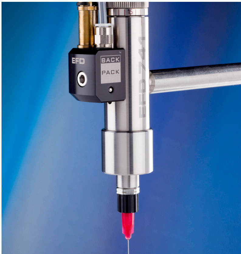
为您的诺信EFD精密点胶阀安装BackPack胶阀驱动器，胶阀驱动速度可达到5-6毫秒。