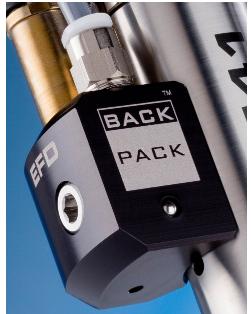
BackPack 驱动器是一款紧凑型、快速响应的电磁阀。