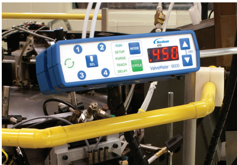
Les contrôleurs ValveMate assurent le contrôle de la taille des déposes.

La taille des déposes dépend essentiellement du temps d'ouverture des valves.