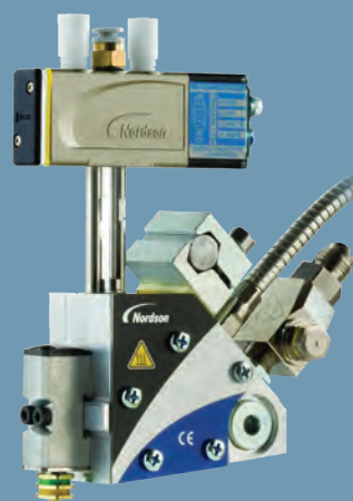
MiniBlue II Standard

Com apenas 18 mm de largura, o aplicador MiniBlue II Slim vem de fábrica com tampas isoladas patenteadas, mantendo os custos de energia baixos, a temperatura do adesivo consistente e os operadores protegidos contra queimaduras.