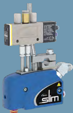
MiniBlue II Slim

Com apenas 18 mm de largura, o aplicador MiniBlue II Slim vem de fábrica com tampas isoladas patenteadas, mantendo os custos de energia baixos, a temperatura do adesivo consistente e os operadores protegidos contra queimaduras.