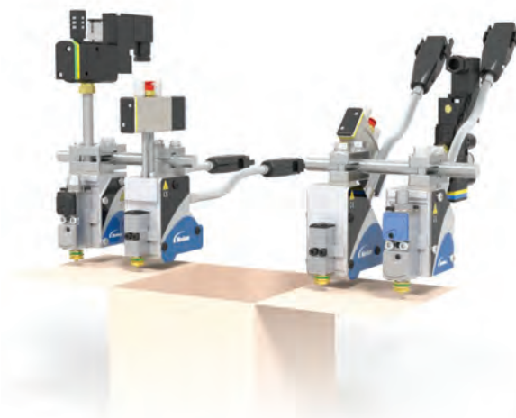
Substituição de Aplicadores Best Choice

Mesmo aplicações altamente especializadas podem aproveitar os benefícios de um aplicador MiniBlue II. Aplicadores de baixo perfil são adequados para casos de uso complexos ou exclusivos.