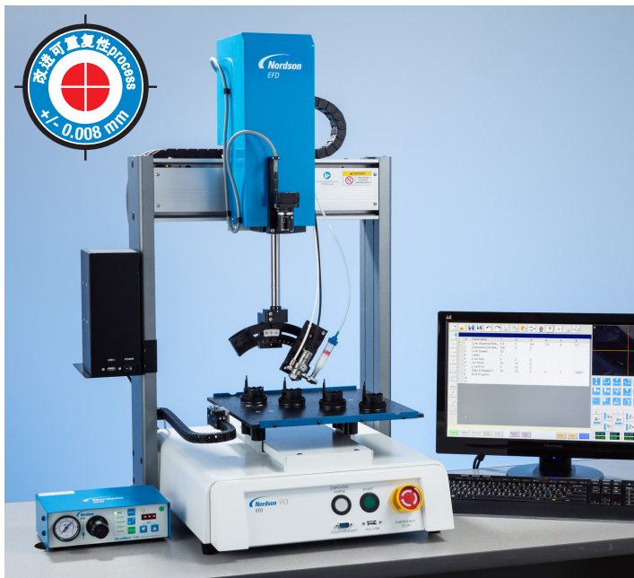
RV系列配备专有的DispenseMotion软件，使得4轴自动化点胶更加便捷。