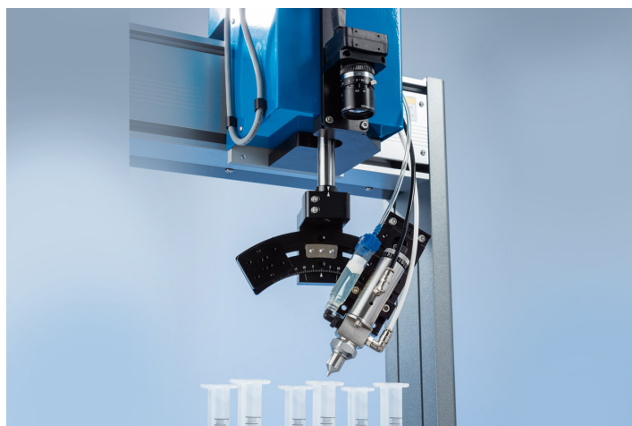
智能视觉CCD摄像头可确认工件的存在及方位。

诺信EFD的RV系列4轴自动化系统可配合EFD点胶针筒和胶阀系统，实现精确的流体点胶。