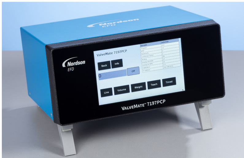
ValveMate 7197PCP semplifica l'installazione e le operazioni delle pompe con cavità progressiva 797PCP.

Controllo Touchscreen per pompe a cavità progressiva Serie 797PCP