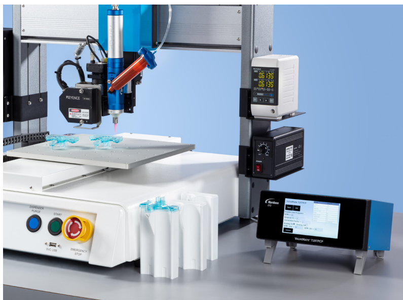
E' possibile effettuare regolazioni in corso d'opera per ottimizzare il controllo del processo di dosatura.

Il touchscreen ad alta risoluzione del controller ValveMate™ 7197PCP offre a portata di mano la possibilità di regolare le impostazioni della dosatura volumetrica.