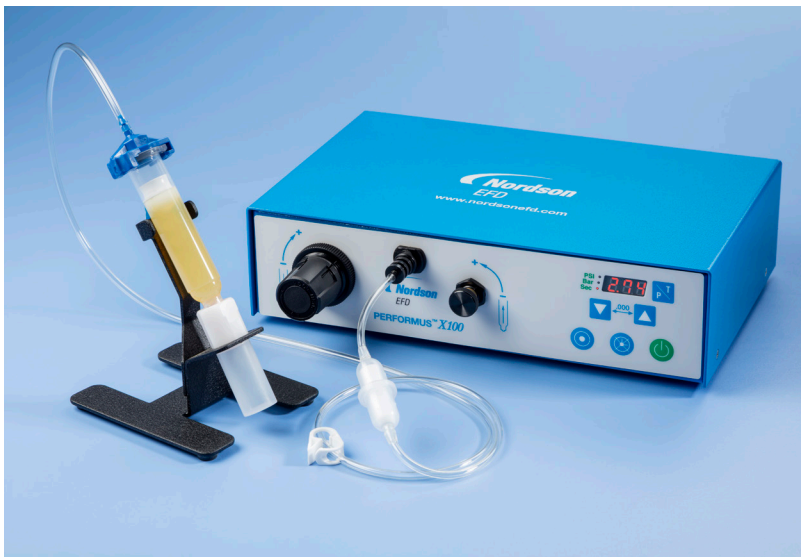
Performus X 点胶机可为广泛行业中的通用应用提供稳定的点胶效果。