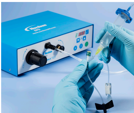
为医疗装置点涂低粘度溶剂。

诺信EFD的Performus™X系列点胶机, 可通过对胶黏剂、润滑剂及其他组装流体的精密控制, 从而增加产能、提高产量并降低生产成本。