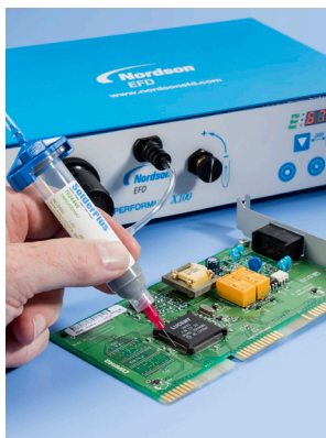
在PCB板上点涂SolderPlus®焊锡膏。