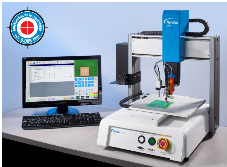
La vision par pointeur caméra de la Série EV facilite la programmation des dessins.

Une solution automatisée avec système de vision