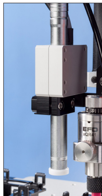
Le pointeur caméra vérifie la présence des pièces.

La Série EV de Nordson EFD comporte un système de vision pour la dépose précise de fluide à l'aide des seringues et des valves de dosage Nordson EFD.