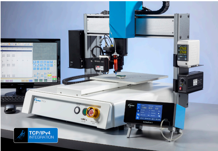
NX 프로토콜을 통해 이더넷으로 개인용 컴퓨터 또는 PLC에서 프로그래밍 가능.