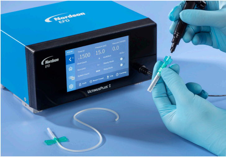
설정 및 프로그래밍을 간소화하는 직관적 터치스크린 인터페이스를 사용하여 업계 최고의 편리함을 경험하십시오.