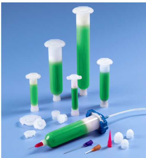
Optimum ECO Kartuschen sind transparent genug um den aktuellen Flüssigkeitsstand zu sehen.

Nordson EFDs Optimum® ECO Dosierkomponenten werden aus nachhaltig gewonnenen Polyethylen hergestellt und bestehen aus 94% bis 96% biobasiertem Material.