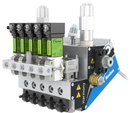
マルチモジュール スプレー アプリケーター