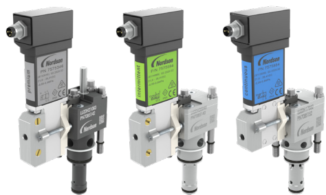
共通のモジュールボアで仕様変更 にも柔軟に対応

上記推奨仕様範囲外でお使いの場合には、本来のパフォーマンスが発揮されない可能性があります