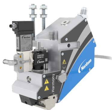
シングルモジュール スロット アプリケーター