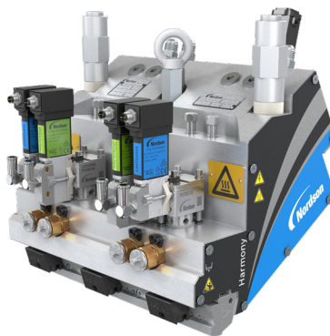
マルチモジュール スロット アプリケーター

詳細については、Nordson 担当者にご連絡いただ くか、または最寄りの Nordson 営業所にお問い 合わせください。