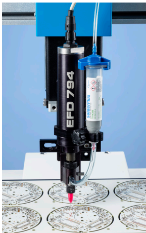
794螺杆阀在火警探测器上点涂EFD的SolderPlus焊锡膏。

ValveMate™ 7194控制器简化了794系列螺杆阀的设置和操作,能够简便调节胶阀开启时间,精确至0.001秒,实现卓越的工艺控制。对于焊锡膏,导电银浆等流体,可选择0-2.0 bar (0-30 psi)的控制器。而对于例如导热膏等更为粘稠的流体,则建议选择0-7.0 bar (0-100 psi)的控制器。