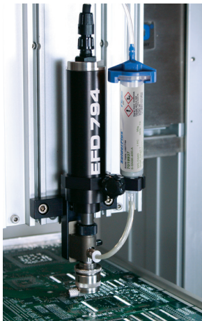
794螺杆阀在PCB板上精确、可重复地点涂EFD焊锡膏。