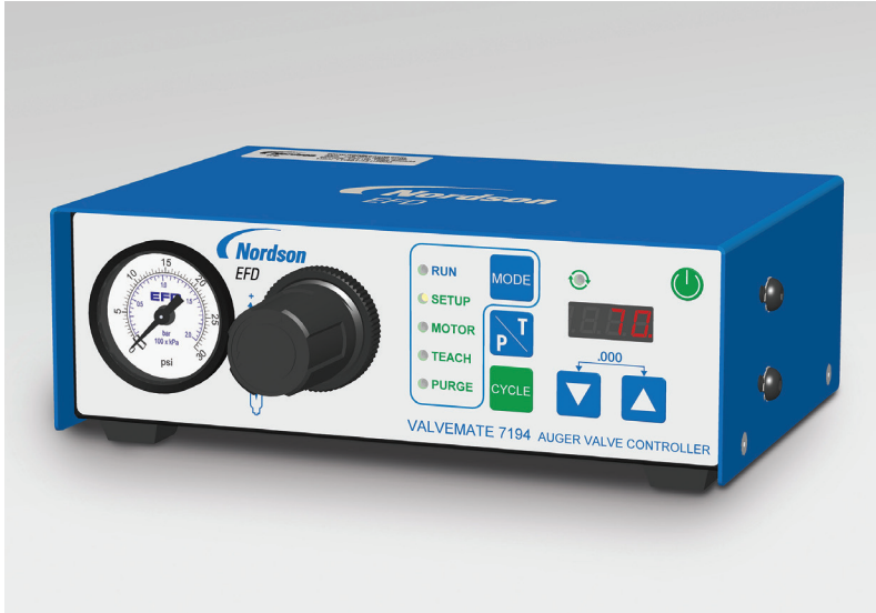
ValveMate 7194 控制器与EFD螺杆阀配套使用,能够提高工艺控制。